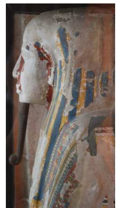
Sarcophage Egypte, XXII e me dynastie – Musée de Morlaix n° inv n°2