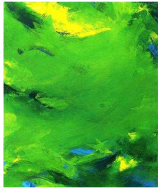
Akantus I , Michael Urtz, 1999 - Musée de Morlaix n° inv 2002.1.1