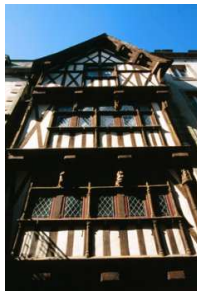
La façade de la maison à Pondalez

Musée de site, musée de territoire, musée citoyen, ce lieu proposera une nouvelle lecture de la collection, composée de ses deux ensembles majeurs, peinture moderne et contemporaine et arts et traditions populaires, à travers l'histoire du territoire du Pays de Morlaix.