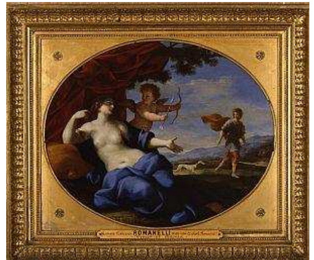
Venus et Adonis , Romanelli, vers 1850 - Musée de Morlaix, dépôt du Musée du Louvre en 1885, n°inv D 1895.1

Edmond Puyo, tout d'abord. Le premier conservateur du musée, à partir de 1885, a donné l'élan initial à l'enrichissement de la collection. Il a mené une politique d'acquisition volontariste auprès de marchands d'art et au Salon de Nantes. Ses choix reflètent le goût officiel de l'époque, davantage porté sur la peinture académique que sur les avant-gardes. Des paysages séduisants, des personnages et des scènes pleines de vie entrent au musée à cette époque.