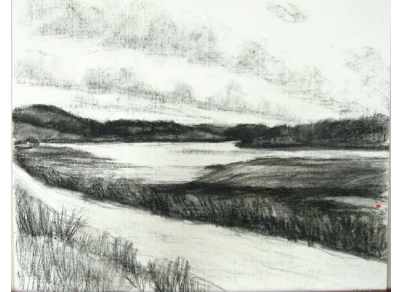
Couchant sur la baie, Agnès Prévost - Collection de l'artiste

La mise en résonance de ses œuvres avec celles de la collection fut précédée d'une résidence de quelques semaines à Traon Nevez, un lieu magique de la Baie de Morlaix, entre forêt et estran. »