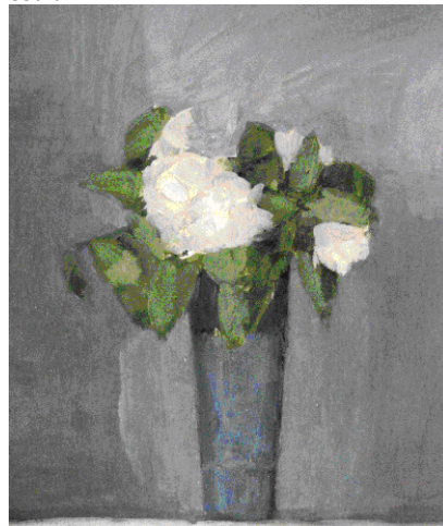
Bouquet, Agnès Prévost - Collection particulière

C'est naturellement que le travail d'Agnès Prévost s'est imposé dans le cadre de cette nouvelle présentation de la collection du Musée de Morlaix, tant cette affinité avec les œuvres de la collection et avec le paysage de la Baie de Morlaix est devenue une évidence tout au long du cheminement que nous avons fait ensemble depuis notre rencontre à Lourmarin en août 2008.