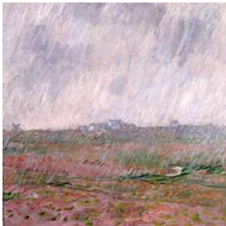
Pluie à Belle-Ile , Claude Monet, 1886 - Musée de Morlaix, n°inv 512