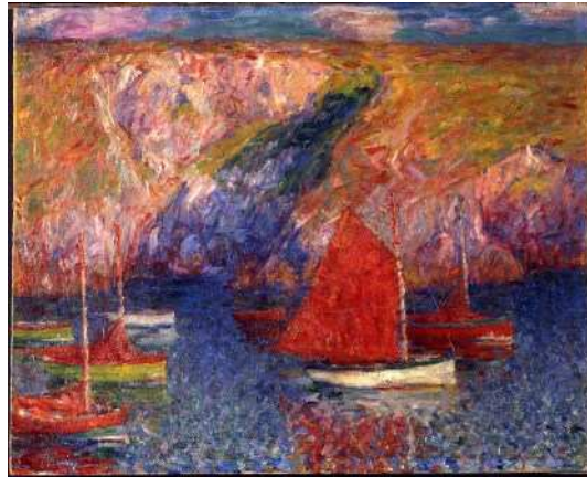
La voile rouge - Port de Goulphar , John-Peter Russell, Ca 1900 – dépôt du Louvre fonds Orsay, n° inv 997.1.1.16