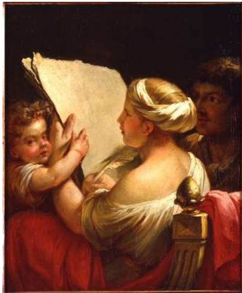
L'Amour professeur, Anonyme, XVIII e s. - Huile sur toile, Musée de Morlaix, inv.348

Morlaix aux Jacobins → le samedi 20 juin à 16 heures