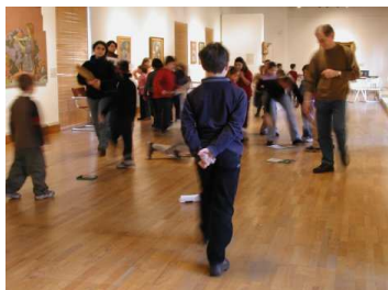
Salle d'exposition des Jacobins

Des œuvres et des objets de la collection –orfèvrerie, piété domestique, mobilier, iconographie ancienne (peintures, dessins, gravures, dioramas) ayant trait à l'histoire de Morlaix à la vie quotidienne de ces maisons, à l'architecture et à l'histoire de la Ville, forment un triple parcours sur 4 niveaux, dans les 6 salles de la maison.